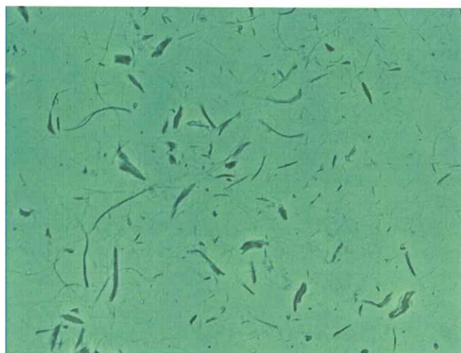
DMレンズ使用時の画像 (ダークコントラスト)