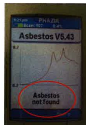
アスベスト検出されず