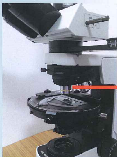
オリンパス社製 偏光顕微鏡

偏光顕微鏡による偏光分散には、専用の分散対物レンズ 米国McCRONE社製偏光顕微鏡用分散対物レンズが最適です。