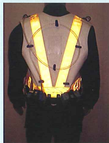
※蛍光テープの効果