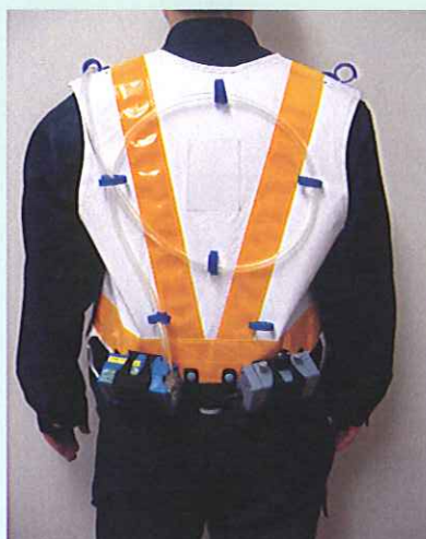
< 背面 > 測定機器等を入れる ポケットが2つあります。

※ 写真は、測定機器等をベストに装着した例です。 (測定機器は付いておりません)