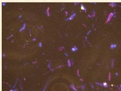
イソライト製1260 屈折率:1.536